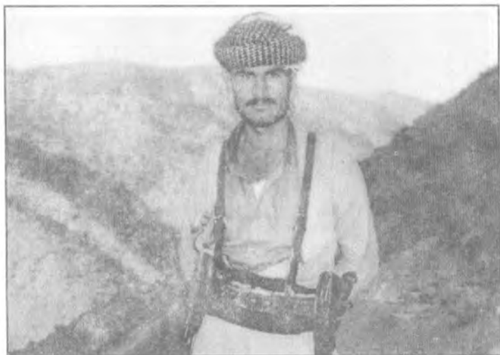
سالی ۱۹۷۸ که ریم عه بنولا مارف