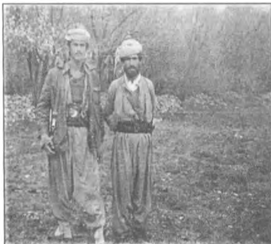
سالی ۱۹۷۹ کاک نه به ز، که ریم عه بنولا مارف