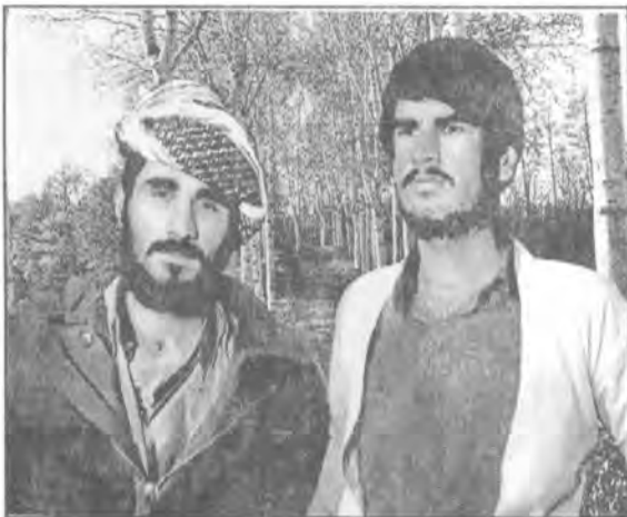
کرتایی مانگی ۱۰ سالی ۱۹۸۰ ،شاری ورمین: که ریم عه بدولا مارف، کاکه خه لیفه م، هه ره مان پلژی به ریوونی کاکه خه لیفه م