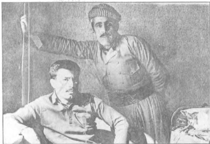
۸-۱۹۷۵ له خهسته خانگی میاندر او له پوژمه لاتی کورستان