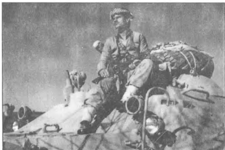
مانگی ۱ سالی ۱۹۷۹ که ریم عه بدولا مارف، شاری سه رده شت