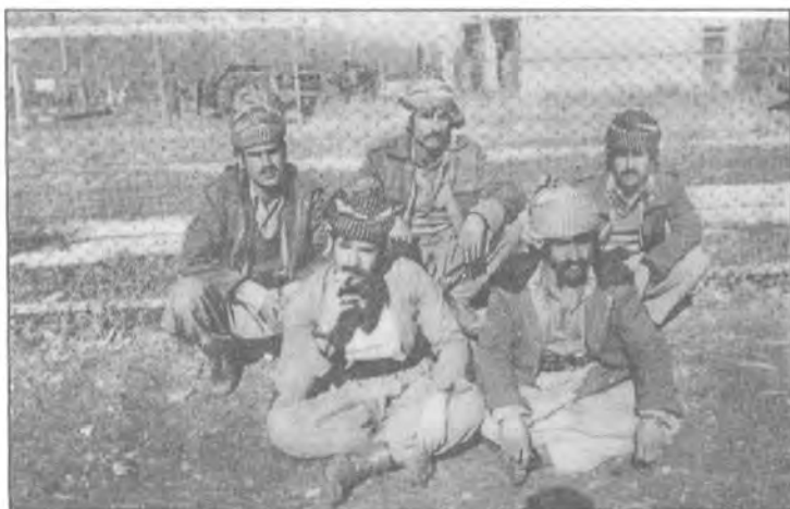
مانگی ۱۱ سالی ۱۹۷۹ نژدیوگای زړوئی، پډلی چوونم بی مانی ده سگیرانی کاکه خه لیفه م خواړه وه: له راسته وه بی چه پ: شهید سواروی لاله مارف، شهید جه لال. سه روه: له راسته وه بی چه پ: شهید شه مال کنگه که روی، شهید کاکه خه لیفه، که ریم عه بنولا مارف