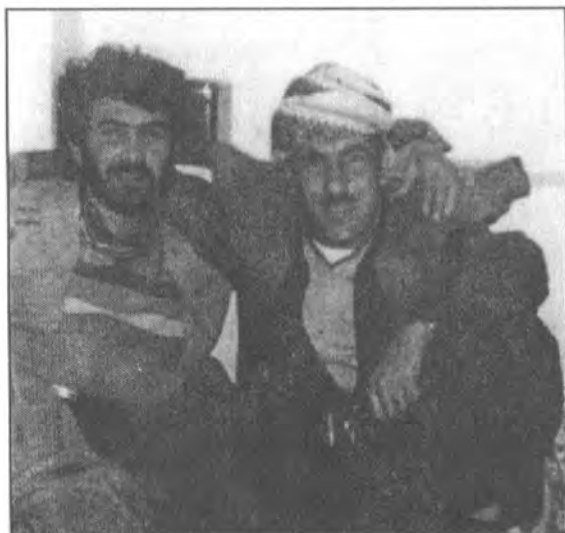
له راسته وه بیل چه پ: شهیدی سرکرده تاهیری عالی والی بهگ، شهید همه بهحیم