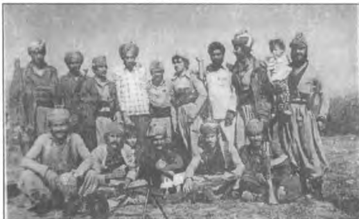
سالی ۱۹۸۱، گوندی که ره دئ، له راسته وه بیل چهپ (به پیئوه): عوسه ی رابه، خه لیفه عه بدولا مارف، هیندی، کاوه ی عریف علی، فه لاهی حه مە ی زه ینب، هیندی، ئەوانی تر نه ناسراون . له راسته وه بیل چهپ (دانیشتوو): وه ستا که مالی برای مه جیه گورگه، نه زانراوه، مه حموود شاره زووی، سه لام، ئەو سن مناله منالی خوالی خورشیدوو مچی بابه که ورن، ئەوانی تر نه ناسراون