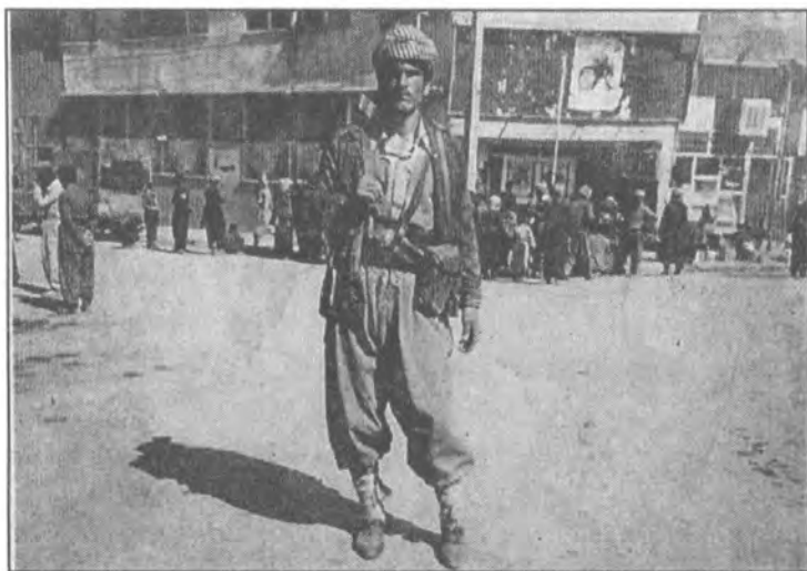
سه رده تاي سالی ۱۹۷۹ کرتنی شاری بانه