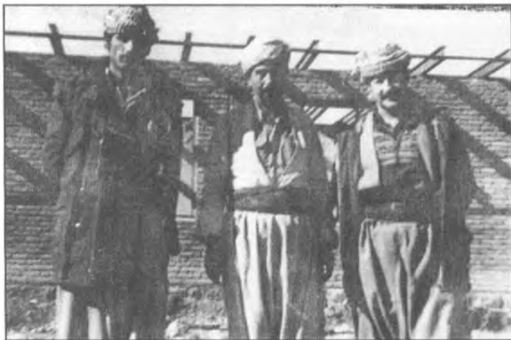
سالی ۱۹۸۰ له راستهوه بڼ چپ سلای قهساب، نه ناسراوه، شهید خلیفه عبدولا مارف