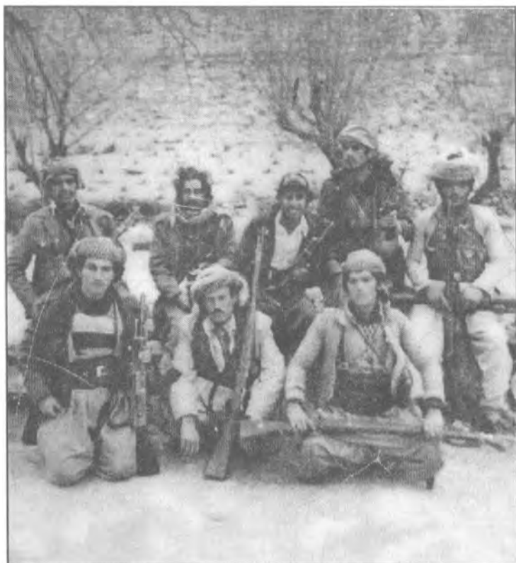
سالی مانگی، ۹ سالی ۱۹۷۸

(له سره روچ - راست بڼ چه پ): که مالی شینخه، که ریم عه بدولا مارف، شههید جه مالی علی بابیر، شههید سه لام کویره کانی، شههید ره سول جوبلاخی. (له خواره روچ - راست بڼ چه پ): سه لام سځ دهری، شههید نه حمده چناره ی، شههید مسته فا کویره کانی ۱۹۷۸ که ریم عه بدولا مارف، چپای ناسوس