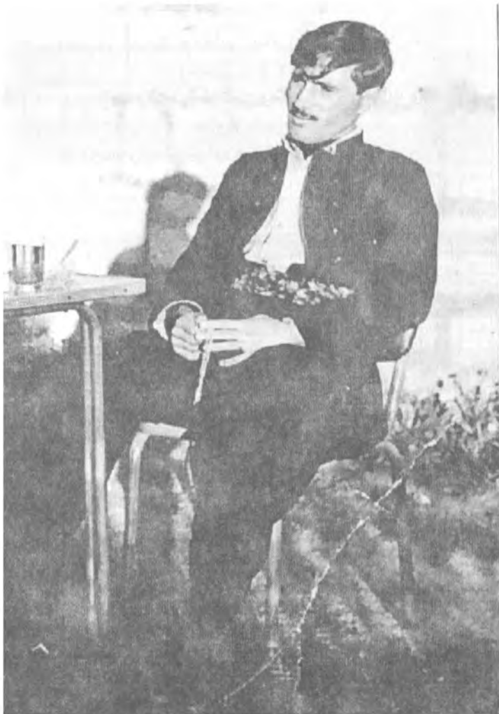
سالی ۱۹۷۳ شهید تالیپ بزستم فرماندهی هریزی شهس شهنامی سرگردیتهی کلمه‌لی په‌نجه‌رانی کوردستان