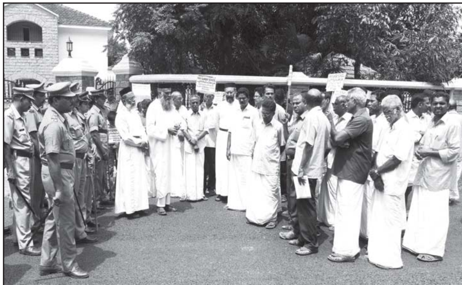
പിറവം എം.കെ. എം. സണ്ടേസ്കൂൾ തല്ലിത്തകർത്ത് മോഷണം നടത്തിയവരെ അറസ്റ്റു ചെയ്തു, സണ്ടേസ്കൂൾ പുനഃസ്ഥാപിക്കണമെന്ന് ആവശ്യപ്പെട്ടുകൊണ്ട് നടത്തിയ പിറവം പോലീസ് സ്റ്റേഷൻ മാർച്ച്