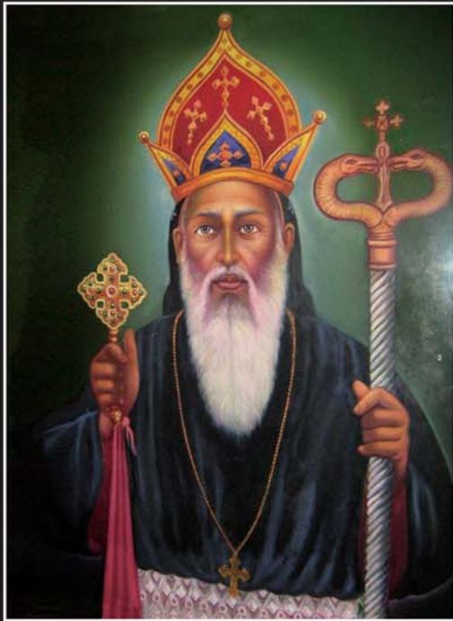
H.B. Marthoma V (1728-65) May -10 Marthoma Methran Burial Tomb: St. Mary's Orthodox Church, Niranam