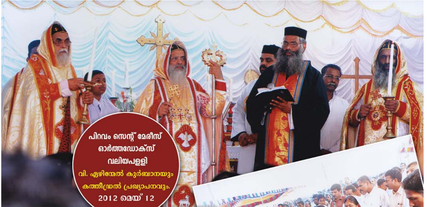
പിറവം സെന്റ് മേരീസ് ഓർത്തഡോക്സ് വലിയപ്പള്ളി വി. ഏഴിന്മേൽ കുർബാനയും കത്തീഡ്രൽ പ്രഖ്യാപനവും. 2012 മെയ് 12