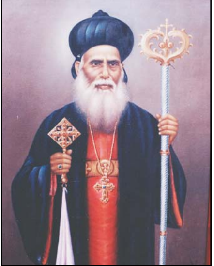
പ. മാർത്തോമ്മാ ശ്ലീഹായുടെ സിംഹാസനത്തിൽ ബസേലിയോസ് ഗീവർഗീസ് പ്രഥമൻ പൗരസ്ത്യ കാതോലിക്കാ

അകാലത്തിൽ പ. പിതാവിന്റെ ഭൗതിക ജീവിതം അസ്തമിക്കാതിരുന്നെങ്കിൽ തീർച്ചയായും പ. മാർത്തോമ്മാശ്ലീഹായുടെ പൗര