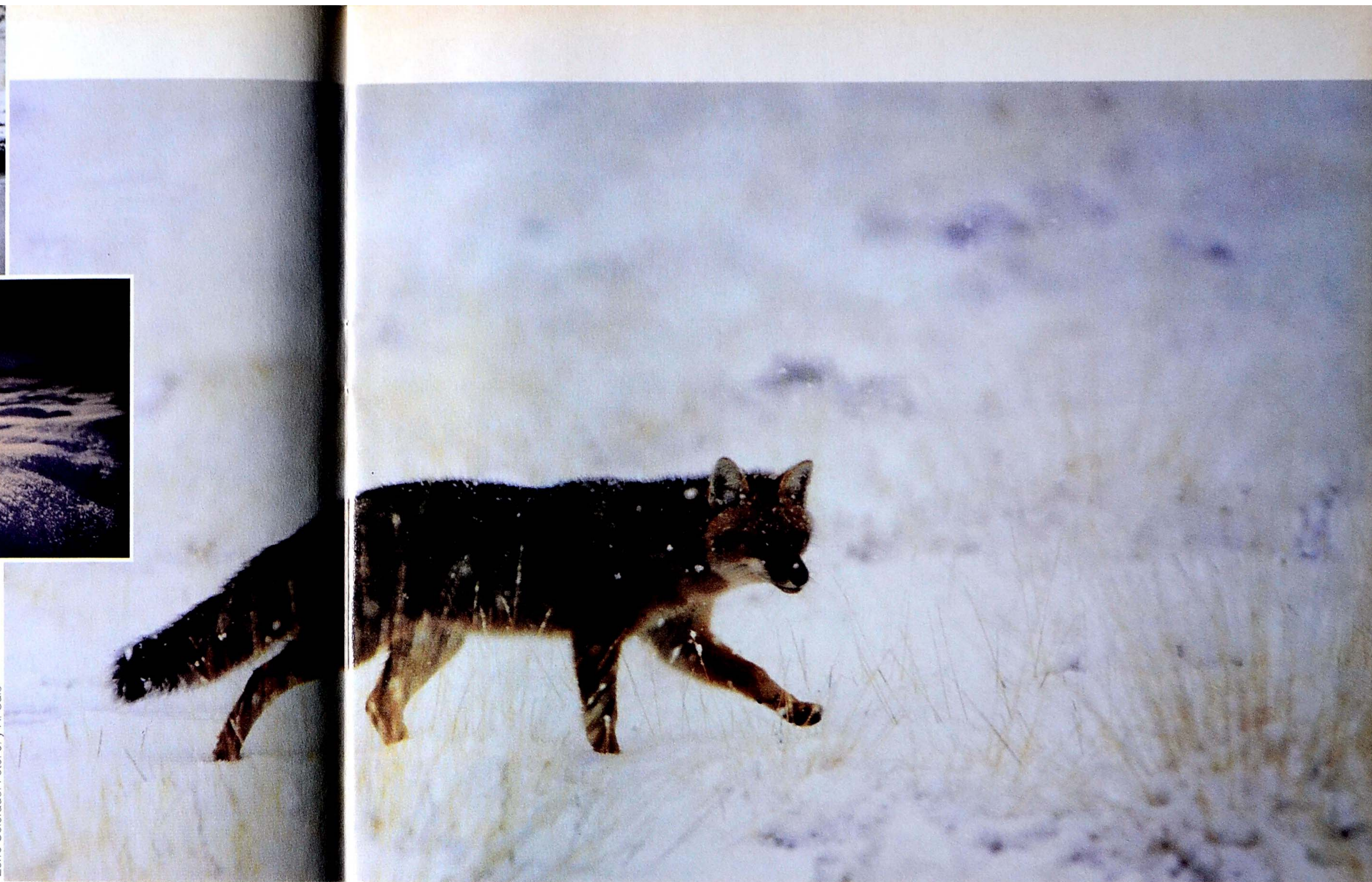
Zorro Colorado.

patagónico se ríe del frío e incluso se atreve a cruzar nadando gelidos ríos y lagos.