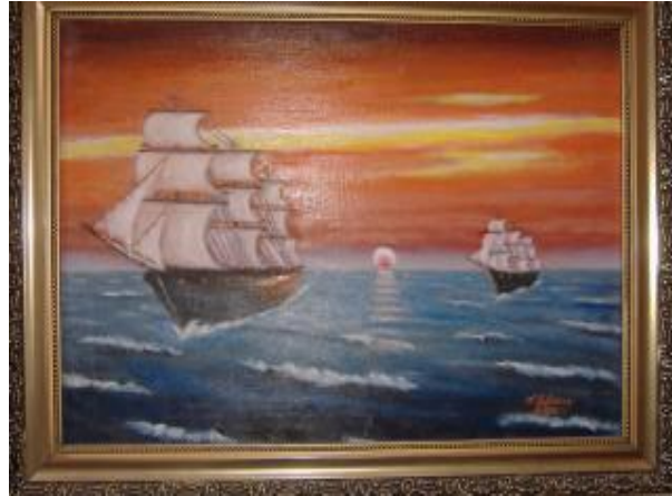
L. Wrzos, olej, 39x29 cm, 2001 r.

Nikt tego nie wypatrzył, nie pomógł, nie wskazał właściwego kierunku kształcenia. Tak miało być. Inni są diamentami, ja piaseczkiem. Takim plażowym, wymytym przez życie. Diamenty dobrze wyglądają na piasku, dzięki temu i piasek nabiera wartości.