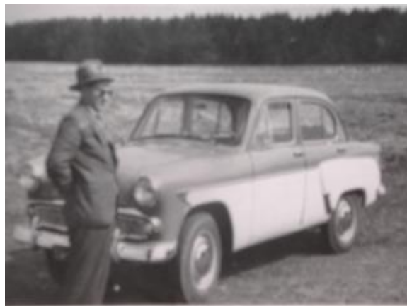
Przy wymarzonem aucie

Zaczęło być pięknie. W 1962 roku kupiliśmy samochód na raty, moskwicza.