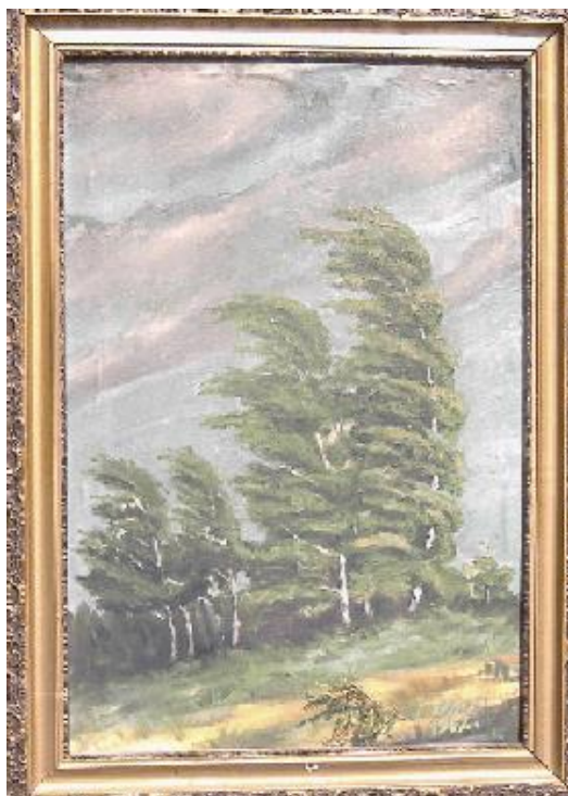
L. Wrzos, olej, 42x64 cm, 1962 r.

Przyłączyłem się do grupy Roszki. Obrałem sobie pseudonim "Wrzos" - jak wrzos leśny: delikatny, skromny... i łatwy do podeptania.