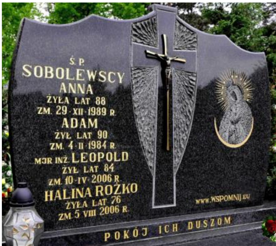
Grób rodzinny na cmentarzu przy ul. Św. Boboli w Białymstoku, po lewej stronie ścieżki drugi grób w rzędzie - ok. 100 m od wejścia na cmentarz rzym.-kat. - 20 m za wysokim krzyżem okolicznościowym (2019)