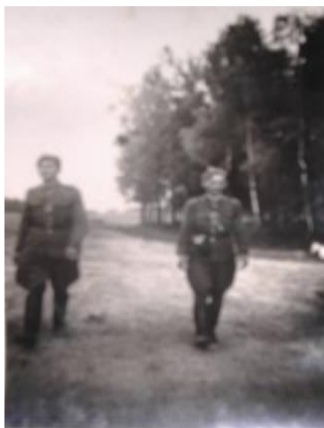
Ja z prawej

Pamiętam dobrze prace minowe na polach Strzelina. Nie mieliśmy żadnej dokumentacji, niemieckich planów rozmieszczenia min. Wiadomo było tylko, że są. W niektórych miejscach stały tabliczki: "Zdies miny". Działaliśmy na wyczucie.