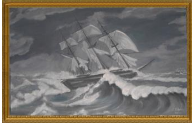
L. Wrzos, olej, 119x73 cm, 1967 r.