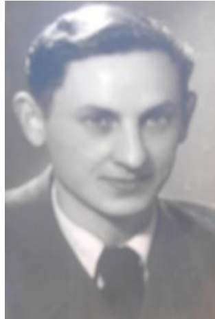
W tamtych latach...