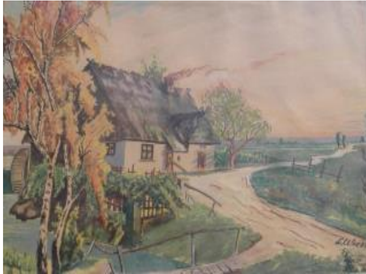
L. Wrzos, akwarela, 39x30 cm, 1953 r.

Domy malowano wapnem na biało zawsze przed Wielkanocą, także ściany wewnątrz domów. A na Zielone Świąta strojono je brzezina, podłogę posypywano pociętym tatarakiem. Stawało się miło, pachnąco, świątecznie.