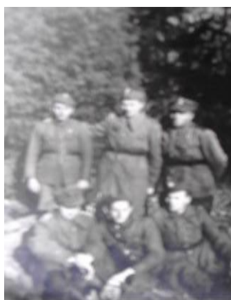
Siedzę w środku

Pewnego razu żołnierze wieźli prowiant z Baligrodu. Na drodze zostali ostrzelani z pobliskich wzgórz. Odpowiedzieli ogniem. Zabito wówczas dwa nasze konie, ale żaden żołnierz nie zginął.