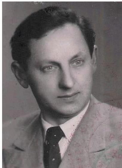
Mogłem zająć wysoko

W pracy zaczęto naciskać, abym wstąpił do partii. Mogłem zająć wysoko w służbowej hierarchii. Odmówiłem, więc podstawiano mi nogi, pomijano w awansach. Zawisła nade mną groźba zwolnienia. W międzyczasie przyznano mi odznaczenie "Zasłużony dla Ziemi Łęborskiej". Demonstracyjnie nie przyjąłem tego odznaczenia i zostałem zdjęty z zajmowanego stanowiska zastępcy kierownika Wydziału Rolnictwa PRN w Łęborku.