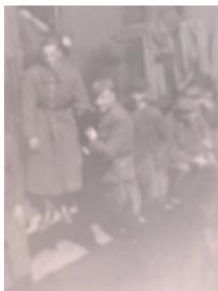
Ja z lewej

Po tygodniu skierowano nas do Oficerskiej Szkoły Saperów w Przemyślu. W kwietniu 1945 roku byłem już po przeszkoleniu i egzaminach oraz z gwiazdką podporucznika. Otrzymałem przydział do 21 Samodzielnego Batalionu Saperów przy 10 Dywizji II Armii Wojska Polskiego. Dywizja ta brała udział w ofensywie styczniowej, idąc w kierunku Drezna przez Czechosłowację.