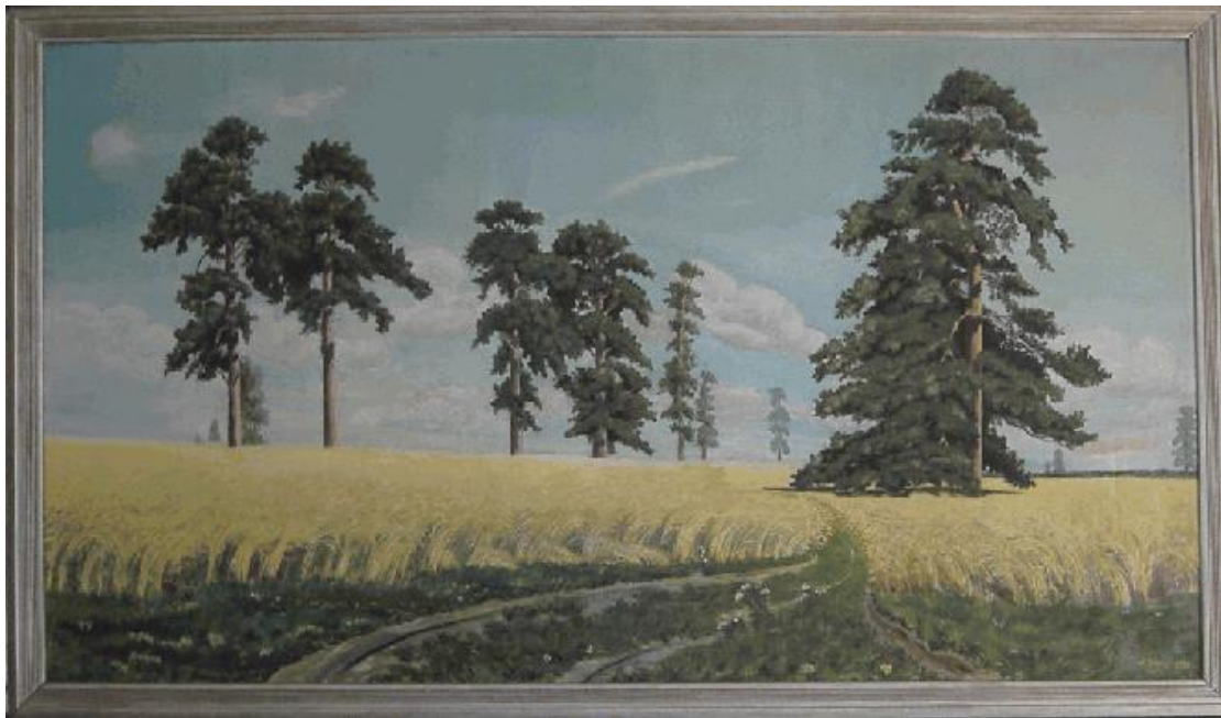
L. Wrzos, olej, 217x122 cm, 1954 r. (wg Szyszkina)

Wracał z Rosji prawie dwa miesiące. Jechał czym się dało: pociągami towarowymi, samochodami, wiele kilometrów szedł pieszo lasami, błotnistymi bezdrożami przez żyto. Jadł to, co znalazł: ziarna zbóż, warzywa, owoce, czasem ktoś dał mu kawałek chleba i zupę. Szedł żebrząc, ale doszedł, zachował jeszcze tyle sił, że wrócił.