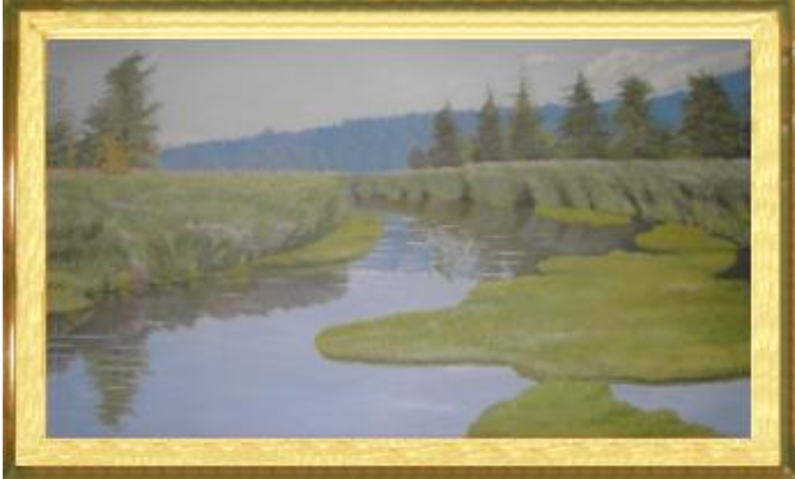
L. Wrzos, olej, 240x137 cm, 1993 r.

Pokochałem Wołkowysk, bo wokół niego wszędzie rozciągały się lasy, opodal miasta płynęła piękna, czysta rzeka Roś, nad którą spędzałem każdy wolny czas: kąpałem się, pływałem kajakiem, łowiłem ryby.