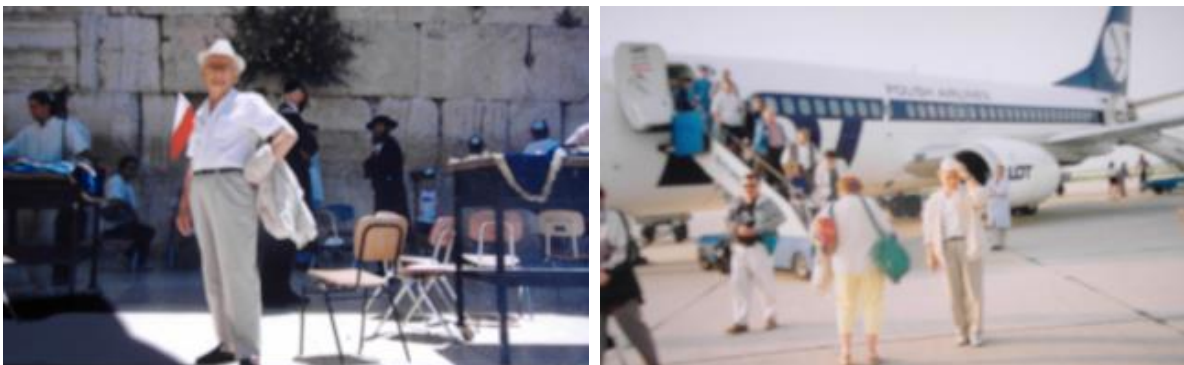
Po "Ścianie płaczu" - lot

Mija mi osiemdziesiąty rok życia. Jestem coraz słabszy fizycznie i zniszczony chorobą, wymagam ciągłej opieki i specjalnego odżywiania. W ostatnich latach trochę popodróżowałem jako turysta. Chciałbym jeszcze zobaczyć - po Jerozolimie, Grecji, Półwyspie Iberyjskim i Maroku - Francję... Ostatnią wycieczkę do Włoch mocno odchorowałem.