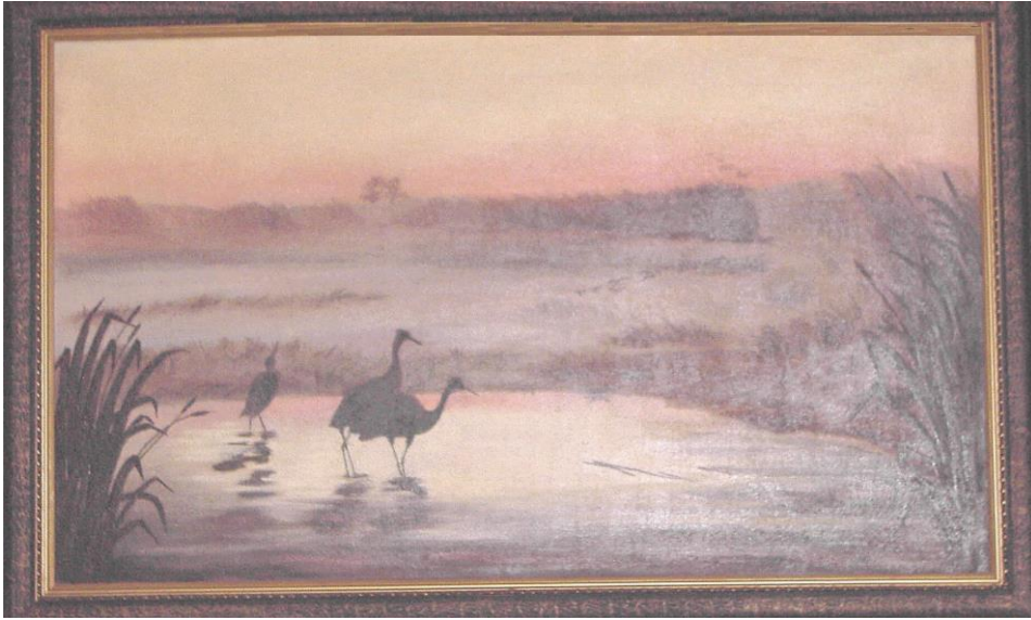
L. Wrzos, olej, 119x70 cm, 1961 r. (wg Chełmońskiego)

Ale to, co piękne, nigdy nie trwa długo. Dały o sobie znać dawne trudy życia. Zachorowałem na wrzody dwunastnicy, ale wyszedłem z choroby. W małżeństwie nie działa się najlepiej.