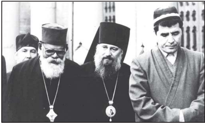
പ. ബസേലിയോസ് മാർത്തോമ്മാ മാത്യുസ് പ്രഥമൻ കാതോലിക്കാബാവാ യോടൊപ്പം

ചരിത്രയാഥാർത്ഥ്യവാദത്തിന്റെ മുഷ്ടിയിൽനിന്നു മോചനം നേടാതെ യഥാർത്ഥ ആരാധനയെ വീണ്ടെടുക്കാനാവില്ല. നൈസർഗികമായ ആരാധനയെ മനസ്സിലാക്കണമെങ്കിൽ ഒട്ടൊക്കെ അവ്യക്തവും കേവലം ആശയങ്ങളിലൊതുക്കി നിർത്താനാവാത്തതുമാണ് ചരിത്രമെന്ന ബോധ്യത്തോടെ അതിനെ അനുസ്മരിക്കുന്നതിനും വീണ്ടും ജീവിക്കുന്നതിനും നമുക്ക് കഴിയണം. ദിവ്യബലി ഇതിന് നമ്മെ സഹായിക്കുന്നു. നിർണ്ണായകമായ ആ ദിവ്യ ചരിത്രസംഭവത്തെ സഭ രചനാത്മകവും വിമോചകവും ആത്മരൂപാന്തര സമർത്ഥവുമായ വിധത്തിൽ ദിവ്യബലിയിൽ വീണ്ടും അനുഭവിക്കുന്നു. ഇത് യഥാർത്ഥമായ ആരാധന നൽകുന്ന സാത്വന്ത്ര്യ പ്രഹർഷത്തിന്റെ അംശമാണ്.